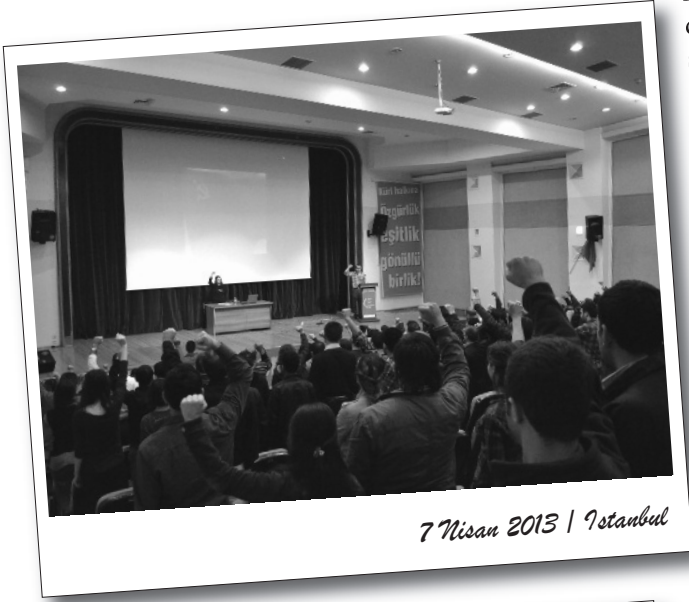
7 Nisan 2013 | İstanbul