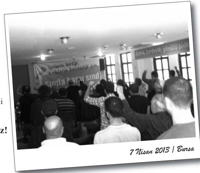
7 Nisan 2013 | Bursa

İki ana tebliğin sunulduğu kurultayda Bosch