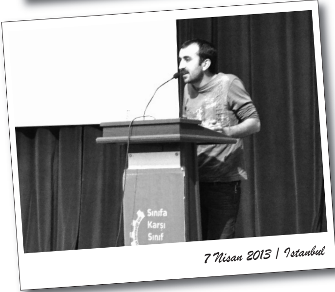
7 Nisan 2013 | İstanbul

Sınıf devrimcilerinin bir süredir çalışmalarını yürüttüğü ve 6 kentte gerçekleştirilmesi planlanan "İşçilerin Birliği Halkların Kardeşliği için Sınıfa Karşı Sınıf Kurultayları'nın ilk ayağı 7 Nisan Pazar günü gerçekleştirildi.