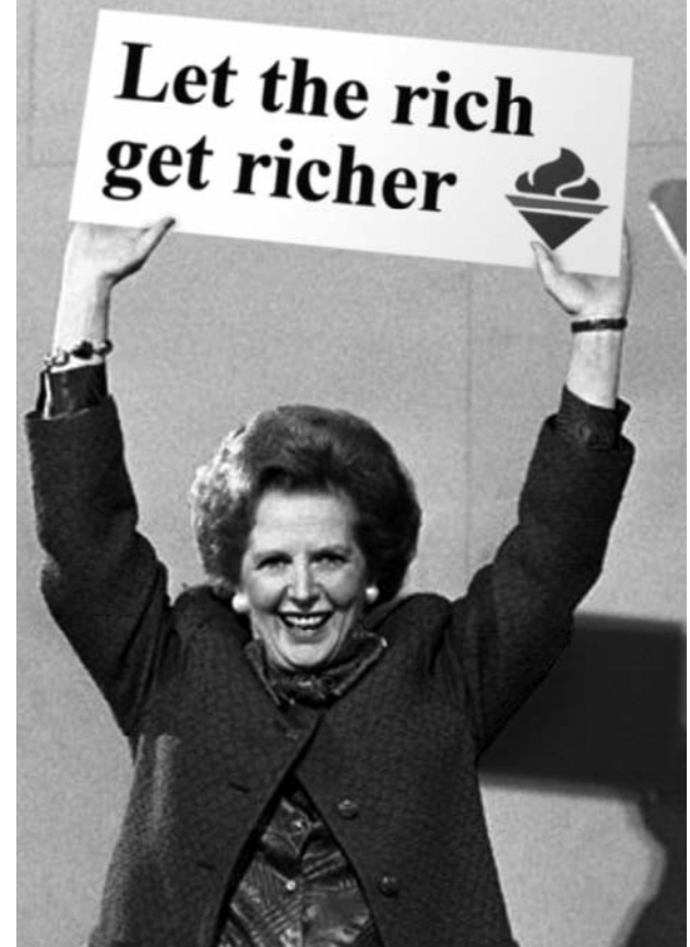
maden işçisi kaldı.

Farklı sektörlerde grevde olan işçiler birbirinden yalıtıldı. Grevler başarısızlıkla sonuçlanırken maden işçileri de aynı akıbete uğradı. Maden ocaklarının büyük bir kısmı kapatıldı, geriye ancak birkaç bin