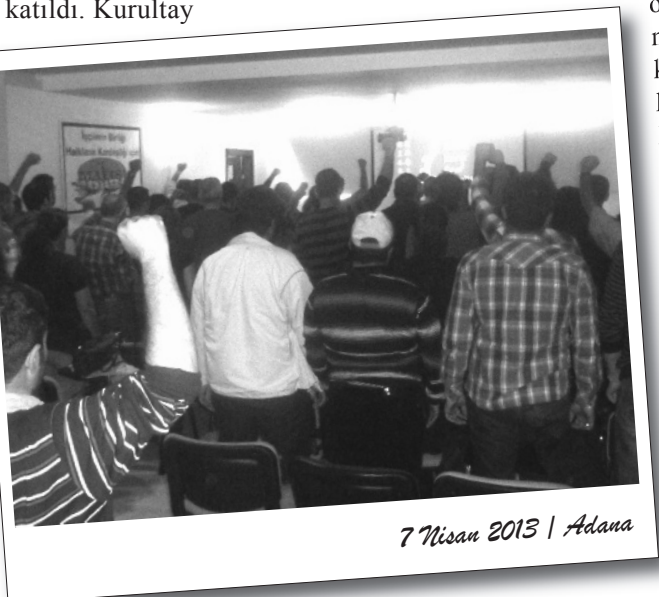
7 Nisan 2013 | Adana