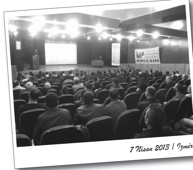
7 Nisan 2013 | İzmir

Konuşmaların sona ermesinin ardından divan adına kapanış konuşması yapıldı ve kurultayın işçi sınıfının Kürt sorunu ve emperyalist savaş konusunda irade beyanı anlamına geldiği belirtildi. Sınıfa karşı sınıf iradesini ete kemiğe büründürmek için kurultayın bir adım olduğu ifade edildi ve 1 Mayıs çağrısı yükseltildi. Kurultay, Adalılar'ın ezgileriyle sona erdi.